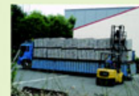
詰められたアルミ缶を積んでいるところ (20kg×5000ヶ)

また、皆さんのご家庭から集められ処理された資源物(スチール缶、アルミ缶、カレット等)を再生工場へ大きなトレーラーで運び出したり、もやせるゴミを処理したもえがら(灰)を埋立処分場へトラックで運び出す際にもここ検量棟で重さを量ります。