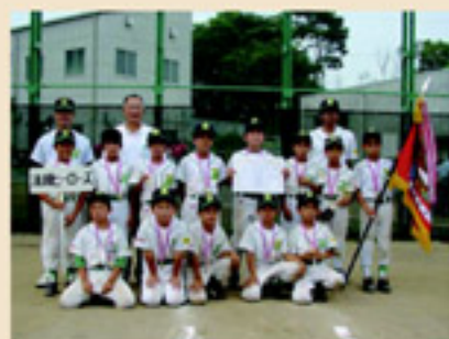
低学年の部優勝チーム 清瀬ヒーローズ