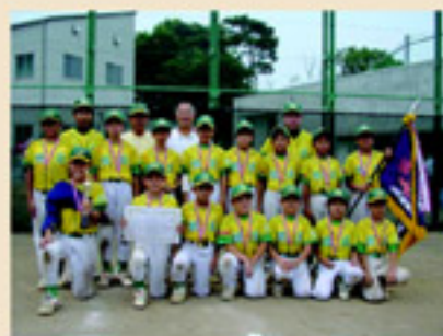
高学年の部優勝チーム 清瀬旭丘

大会には、清瀬市、東久留米市、西東京市代表の高学年3チーム、低学年3チームの合わせて6チームが参加し、日頃の練習の成果を競い合いました。