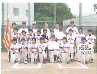
低学年の部優勝チーム 東久留米アストロズ

平成21年7月20日(月)に第8回学童野球大会が行われました。大会参加チームは、清瀬市、東久留米市、西東京市代表の高学年3チーム、低学年3チームの合わせ6チームが参加し、日頃の練習の成果を競い合いました。