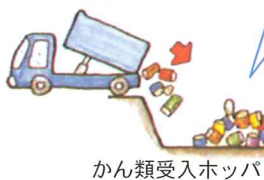
かん類受入ホッパ