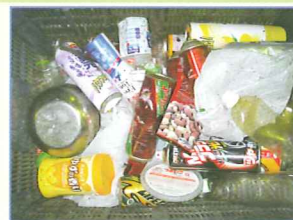
混入していた雑物や中身の入った スプレーかん

飲料用かんは、再資源化するために資源物として分別収集しています。 しかし、これらを再資源化するとき、かん以外のものが混入してい たり、容器に中身が残っていると再生加工が困難になり、再商品化がで きなくなってしまうことがあります。 ルールに従った適切な分別 にご協 力ください。