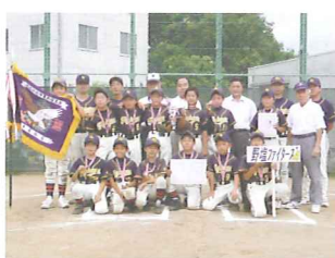
高学年の部優勝チーム 野塩ファイターズ

●休館日：毎週木曜日、年末年始 ●お問い合わせ：グランドパーク ☎042-473-3121