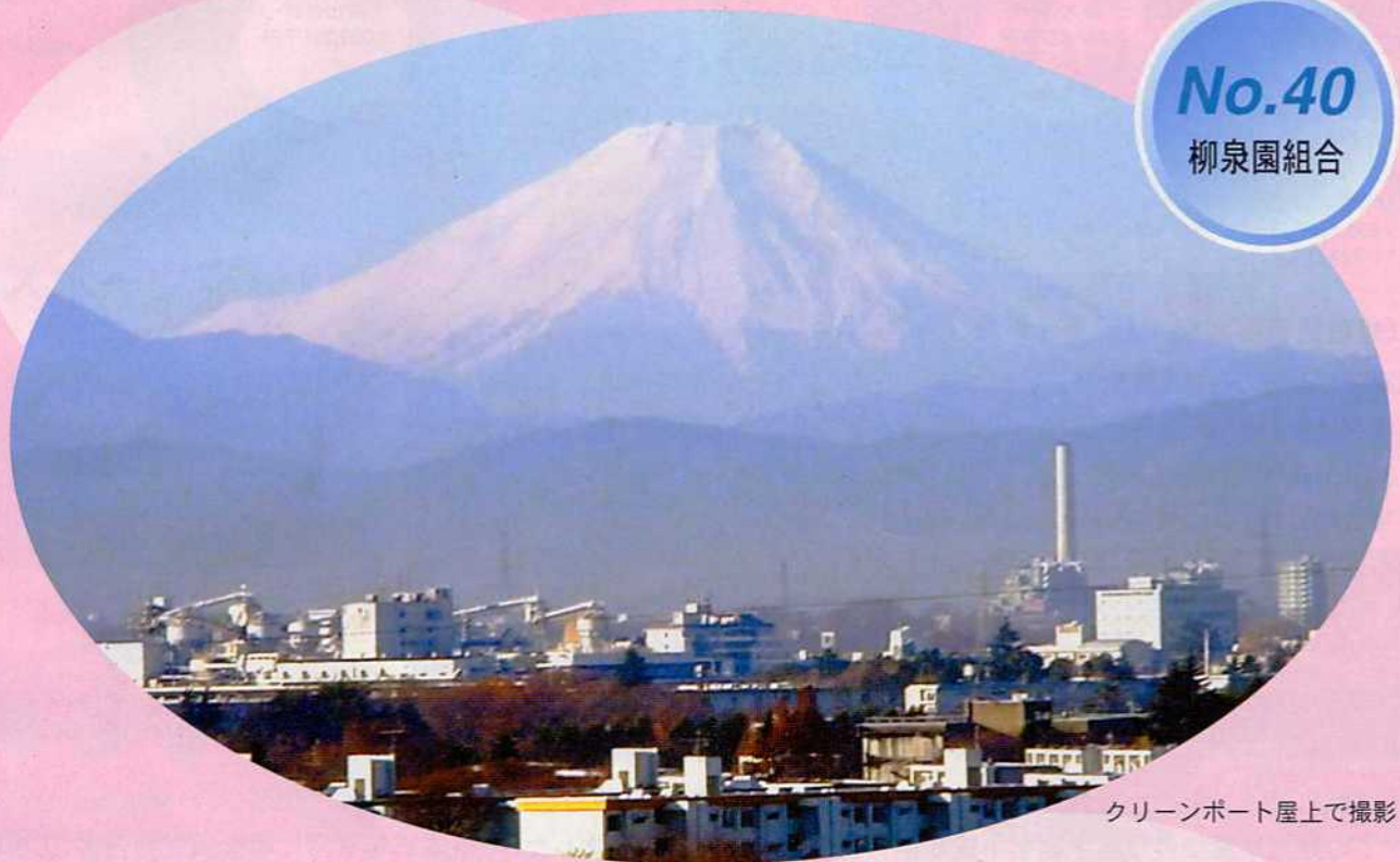
クリーンポート屋上で撮影